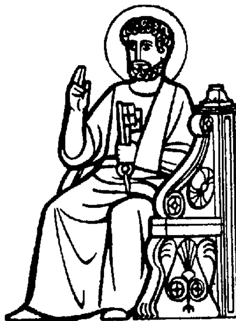
Katedra svätého Petra, apoštola